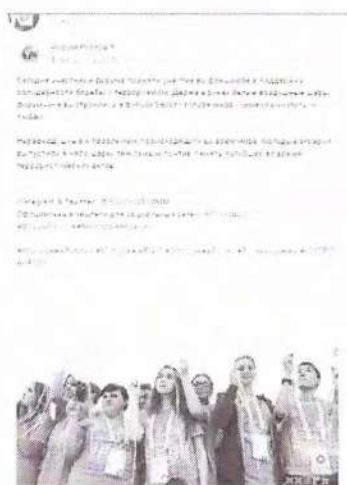
Рисунок 7 – Информация о проходящем мероприятии в социальной сети «ВКонтакте»

Видеоматериал как один из результатов состоявшейся акции был распространен через отдельную публикацию (см. рисунок 8).