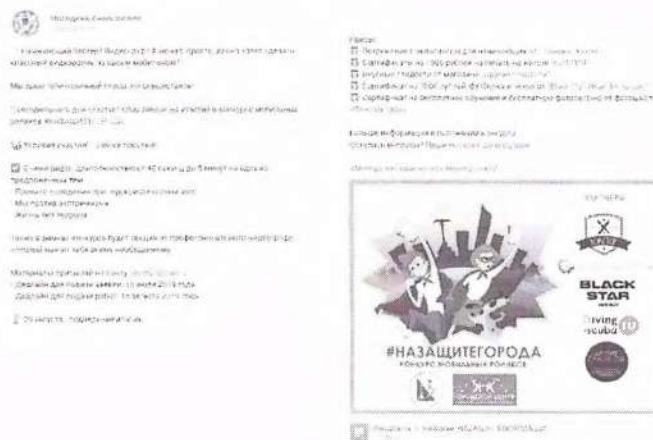
Рисунок 1 – Анонс мероприятия в социальной сети

В анонсе должна содержаться информация, разъясняющая что, где, когда и кем проводится. Данные могут предоставляться дозированно, обязательный элемент – наличие прямых контактов организаторов (см. рисунок 1).