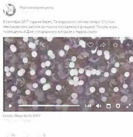
Рисунок 8 – Информация о прошедшем мероприятии в социальной сети «ВКонтакте»

Видеоматериал как один из результатов состоявшейся акции был распространен через отдельную публикацию (см. рисунок 8).