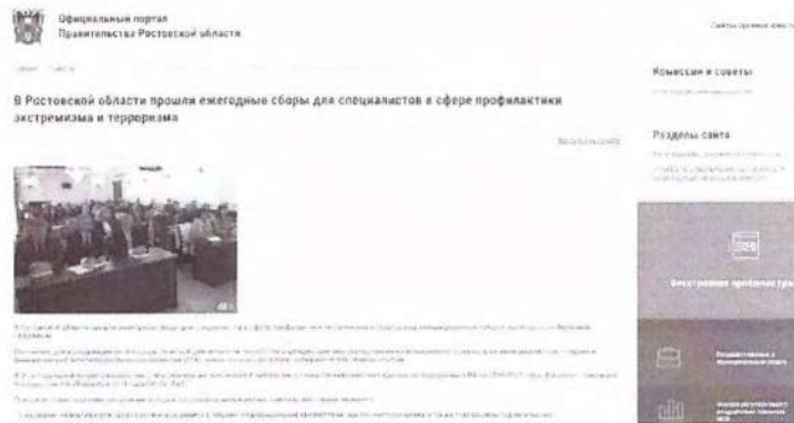
Рисунок 10 – Информация о прошедшем мероприятии

Иллюстрацией информационного освещения мероприятий такого рода является проведение ежегодных сборов для специалистов, организованных Антитеррористической комиссией Ростовской области. В новостной публикации сообщается, что ключевой темой встречи было обсуждение принятого Комплексного плана–2023, также в программу сборов входили лекции представителей силовых ведомств, регионального министерства образования и департамента потребительского рынка (см. рисунок 10).