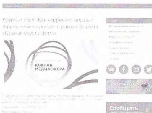
Рисунок 9 – Информация о предстоящем мероприятии

Данный пункт можно проиллюстрировать мероприятием – Круглый стол «Как корректно писать о терроризме», который прошел в рамках форума «Южная медиасфера» (см рисунок 9).