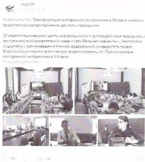
Рисунок 12 – Информация о прошедшем мероприятии