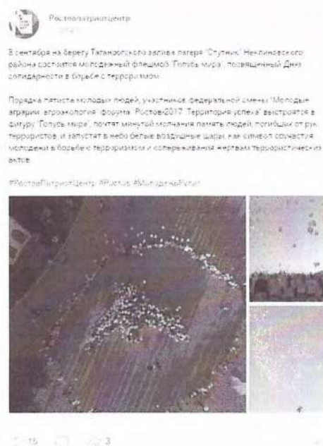
Рисунок 6 – Информация о предстоящем мероприятии в социальной сети «ВКонтакте»

Иллюстративным примером можно привести акцию памяти «Голубь мира», проведенную Ростовпатриотцентром в 2017 году. В сети Интернет была размещена анонсирующая информация (см. рисунок 6).