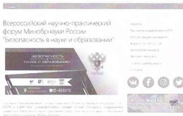
Рисунок 2 – Краткий пресс-релиз

Краткий пресс-релиз обычно содержит информацию с приглашением посетить мероприятие, зарегистрироваться или получить аккредитацию для представителей СМИ. Пример размещенного пресс-релиза продемонстрирован на рисунке 2.