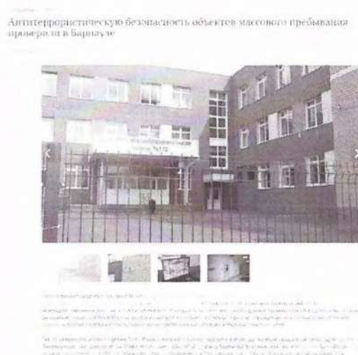
Рисунок 11– Информация о прошедшем мероприятии

Другой пример – мероприятие по мониторингу обеспечения антитеррористической безопасности объектов массового пребывания в г. Барнаул (см. рисунок 11).